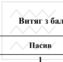
Таблиця 28 Витяг з балансу розділу I пасиву «Власний капітал»